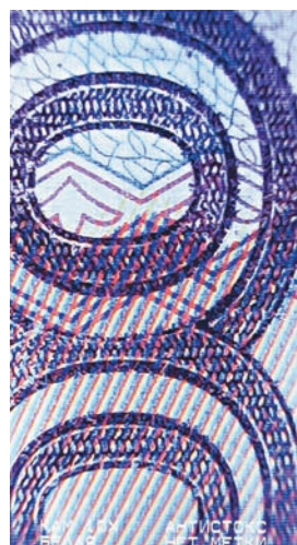
Орловский режим: видимый образ