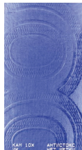
Орловский режим: ИК образ