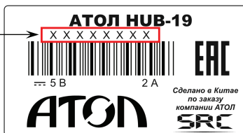
Рисунок 1. Расположение маркировки на нижней части корпуса УТМ АТОЛ HUB-19