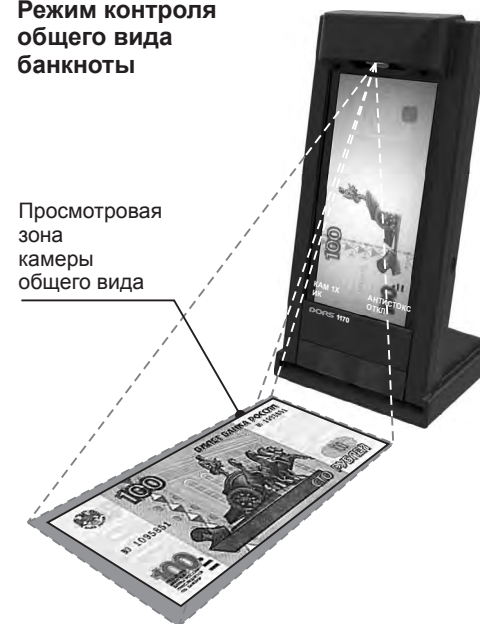
Рис. 2 Режим контроля общего вида банкноты